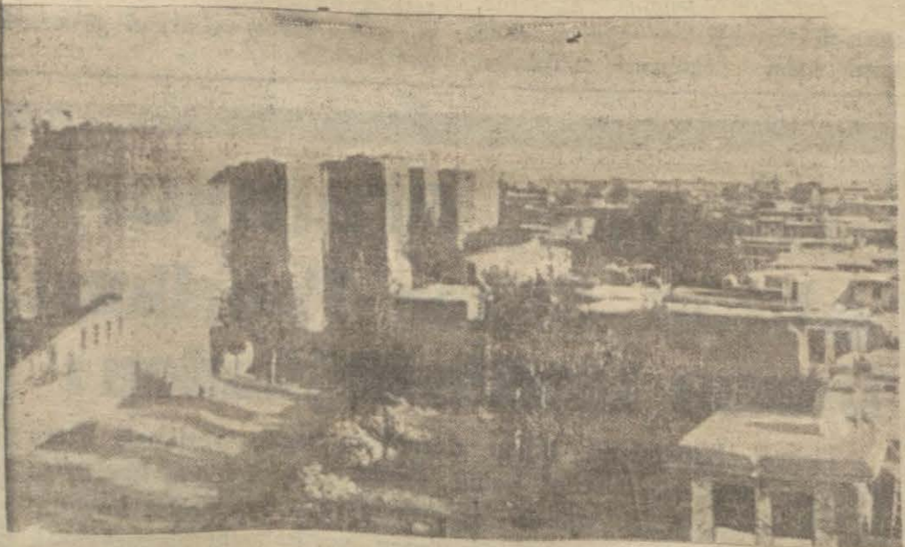
Kale kenarından şehre bakış

Sabahleyin yaz mevsiminde dağ kapusuna doğru bakarsanız o kapıdan birçok atlı ve eşeklinin şehre girdiğini görürsünüz eşeklerin üstünde torba ve küfelerin içinde kavun ve karpuzun envayı vardır. Halkı hâlis Türktür. Zeki ve iş adamıdır. Ziya Gökaltı, Mizanül'edep sahibi merhum Sait Paşayı, Süleyman