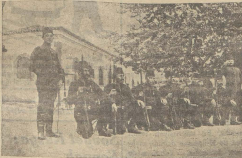
Üçüncü orduya mensup, güzide bir monga

Rumeli yeniden bir kan ve ateş sahnesi haline almış, Yemen, Asir, Havran, Kerek ve havalsinden de gelen kanlı haberler de artmıştı... İstanbul'da bulunan devlet ve milletin ricali daha hâlâ derin bir gaflet içindelerdi. Meşum tâli ve tesadüflerle devlet ve milleti korkunç bir uçuruma sürükleyen Hakkı Paşa kabinesinin, en sakim mutaleat ve icraâtı bile meclisteki ekseriyet fırkası